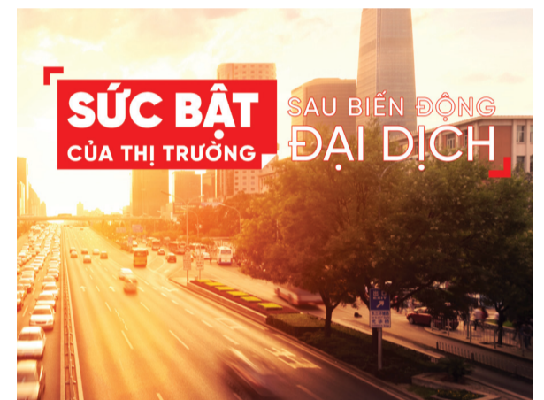
Bản tin thị trường Buzz 360° được phát sóng hàng tháng tại fanpage DKRA Vietnam và DKRA Research & Development.